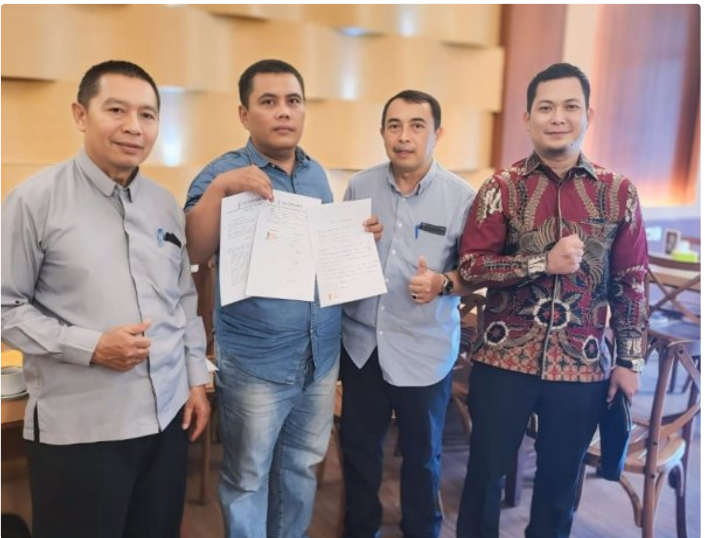
Kuasa Hukum Ningto Wahyu Dens & Partners Lawfirm di perkara Dugaan Pemalsuan Data dan Kredit Fiktif di Bank BRI Unit Kalideres.

JAKARTA, JNI - Seorang bekas nasabah Bank BRI, yang dikenal dengan inisial NW, melaporkan dugaan pemalsuan data dan kredit fiktif yang melibatkan oknum